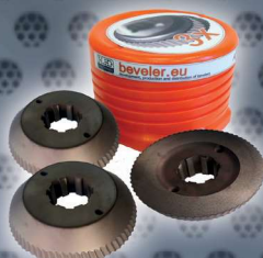
Art. Nr. 1972 set of 3 cutters ECO - UZ29 Art. Nr. 1970 (price advantage)