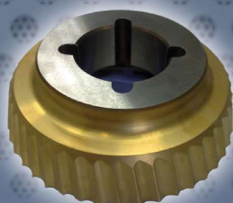
Art. Nr. 2136 cutter PREMIUM - UZ15