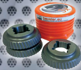
Art. Nr. 2134 set of 3 cutters ECO - UZ15 Art. Nr. 2137 (price advantage)