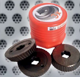
Art. Nr. 1935 set of 3 cutters PVD - UZ12 Art. Nr. 1916 (price advantage)