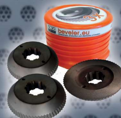
Art. Nr. 1973 set of 3 cutters PVD - UZ29 Art. Nr. 1971 (price advantage)