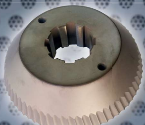
Art. Nr. 1970 cutter ECO - UZ29