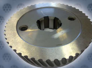
Art. Nr. 2135 - CEVISA