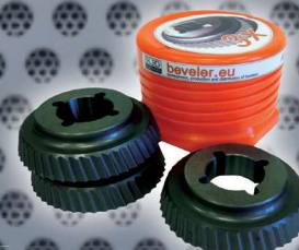
Art. Nr. 1936 set of 3 cutters PVD - UZ15 Art. Nr. 2142 (price advantage)