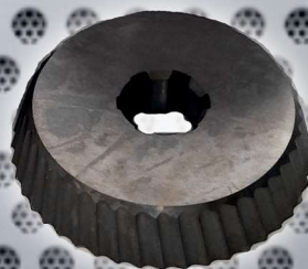
Art. Nr. 1916 cutter PVD - UZ12