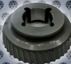
Art. Nr. 2142 cutter PVD - UZ15