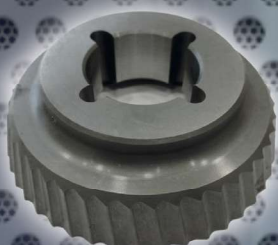
Art. Nr. 2137 cutter ECO - UZ15