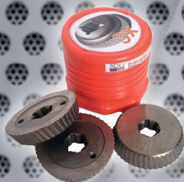
Art. Nr. 1928 set of 3 cutters ECO - UZ12 Art. Nr. 1927 (price advantage)