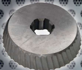
Art. Nr. 1927 cutter ECO - UZ12